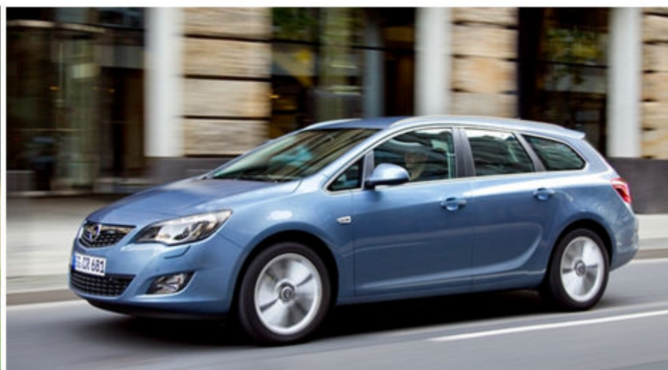
Astra Sports Tourer 1.4 Turbo LPG ecoFLEX (CO2 132 g/km)