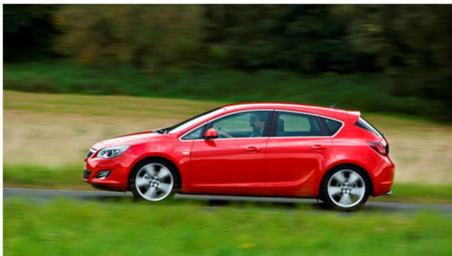
Astra HB5 1.4 Turbo LPG ecoFLEX (CO2 129g/km)